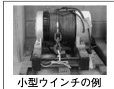
小型ウインチの例