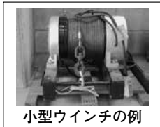
小型ウインチの例