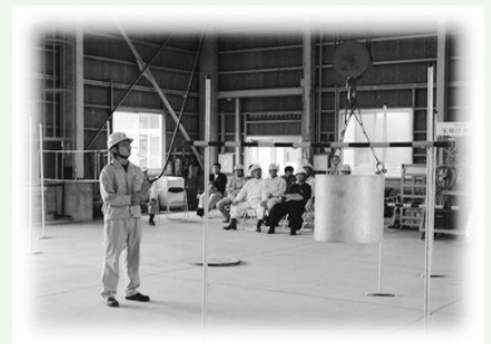
ホイスト式天井クレーン(つり上げ荷重2.8t)を用いて障害物につり荷を当てないように慎重に操作する受講生