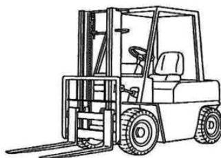
カウンターバランスフォークリフト