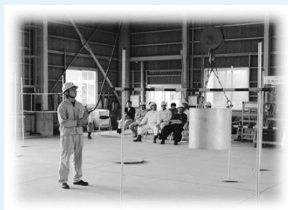
ホイスト式天井クレーン(つり上げ荷重2.8t)を用いて障害物につり荷を当てないように慎重に操作する受講生