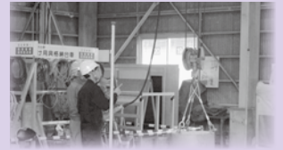
ボイラ・クレーン安全協会「床上クレーン運転教習 床上操作式クレーンを慎重に操作する受講生本」より